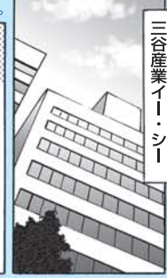
三谷産業イー・シー