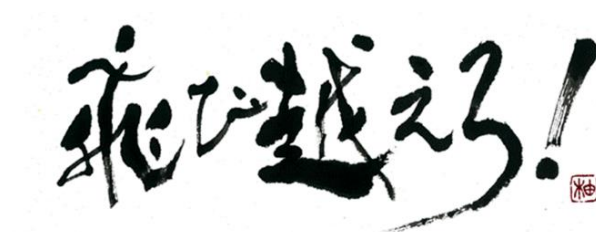
LEAP OVER キービジュアル

なお三谷産業は、第3期 LEAP OVER にも参画しており、今回で二度目の協賛となります。