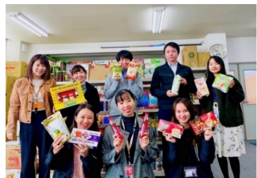
運営メンバー（前列右がハン社員）