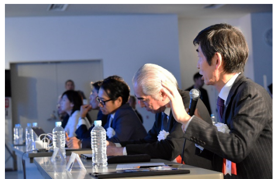
審査員による質疑応答の様様